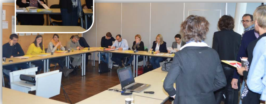
Réunion à la CCI Seine Estuaire le 4 mai 2017