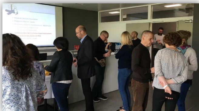
Réunion à la CCI Ouest Normandie le 28 avril 2017